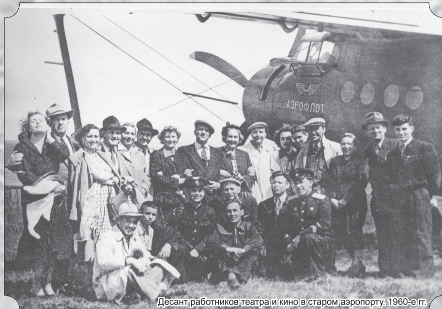
Десант работников театра и кино в старом аэропорту. 1960-е гг.