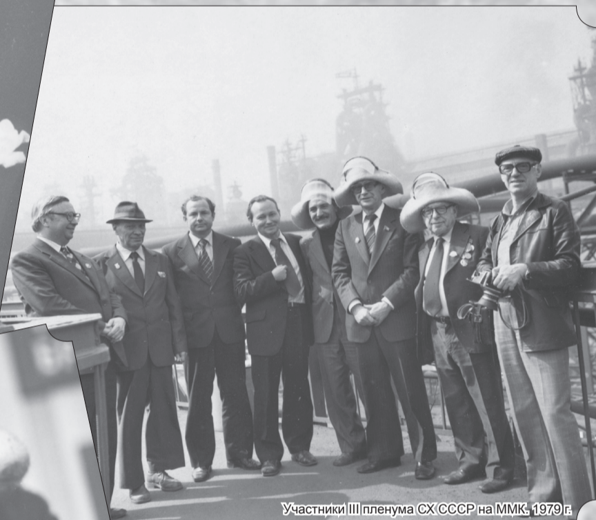
Участники III пленума СХ СССР на ММК. 1979 г.