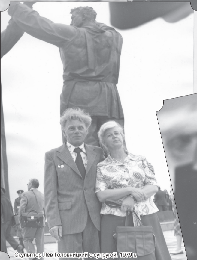
Скульптор Лев Головницкий с супругой. 1979 г.