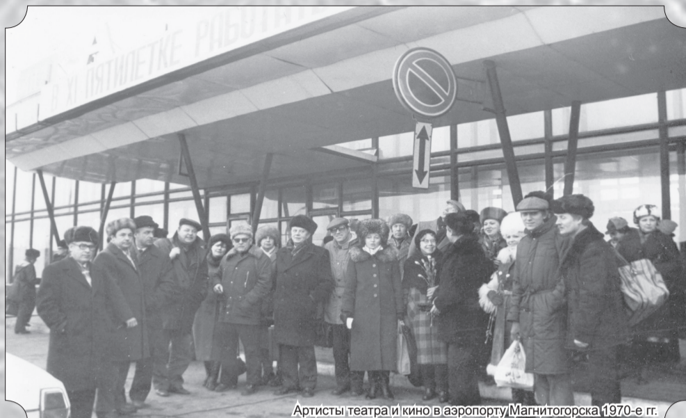
Артисты театра и кино в аэропорту Магнитогорска 1970-е гг.