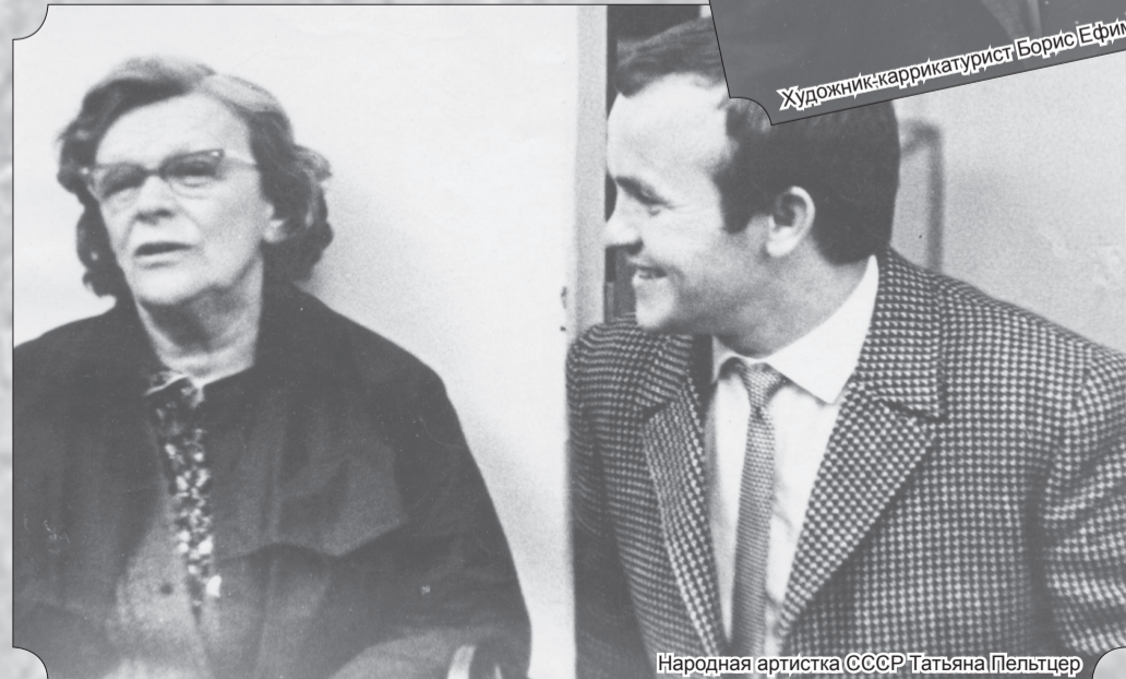
Народная артистка СССР Татьяна Пельтцер