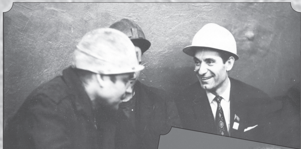
Нар. артист СССР Махмуд Эсамбаев. 1980-е гг.