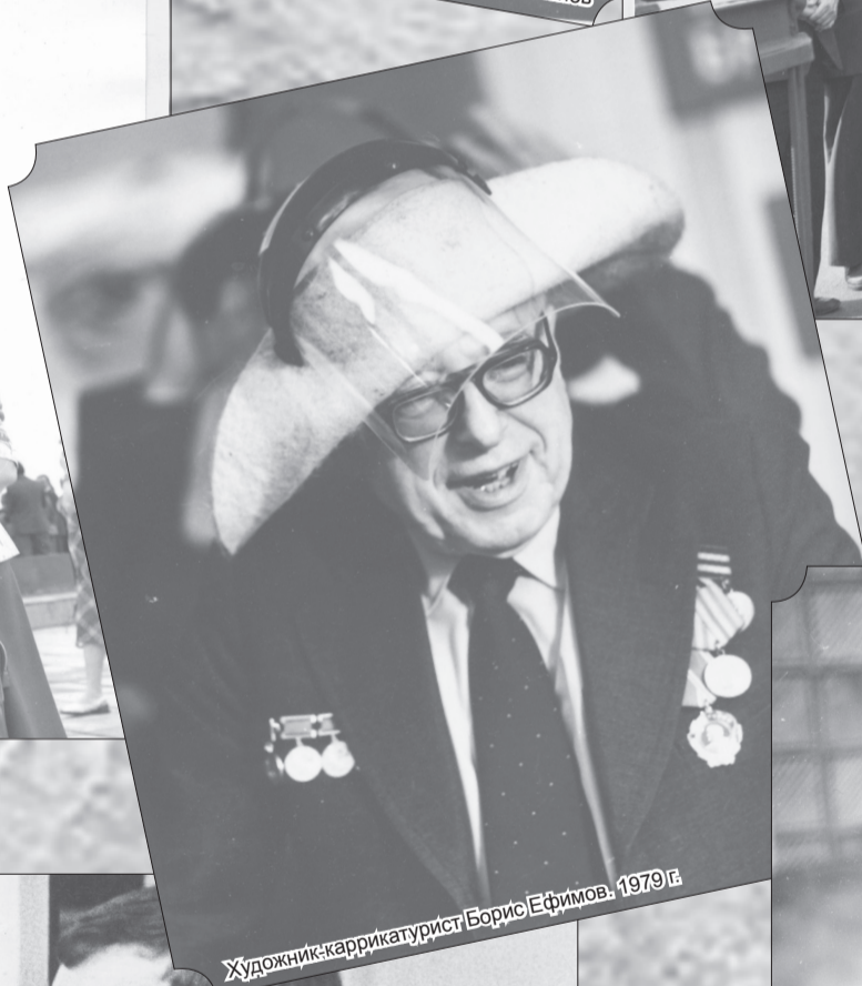
Художник-карикатурист Борис Ефимов. 1979 г.