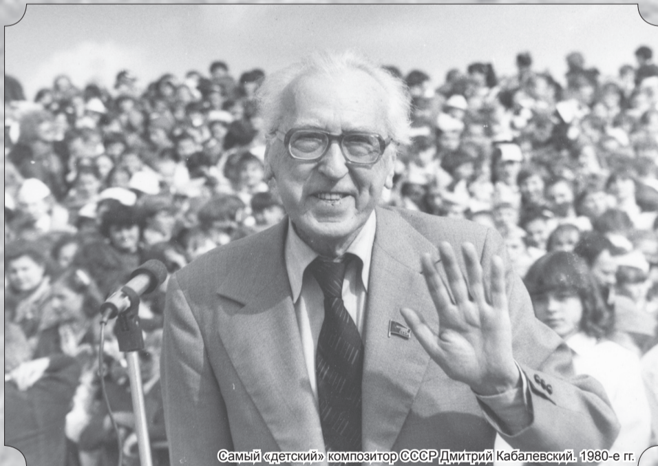
Самый «детский» композитор СССР Дмитрий Кабалевский. 1980-е гг.