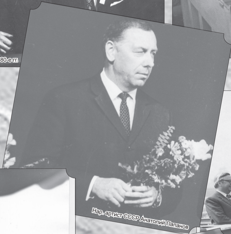
Нар. артист СССР Анатолий Папанов