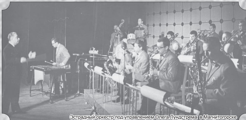
Эстрадный оркестр под управлением Олега Лундстрема в Магнитогорске