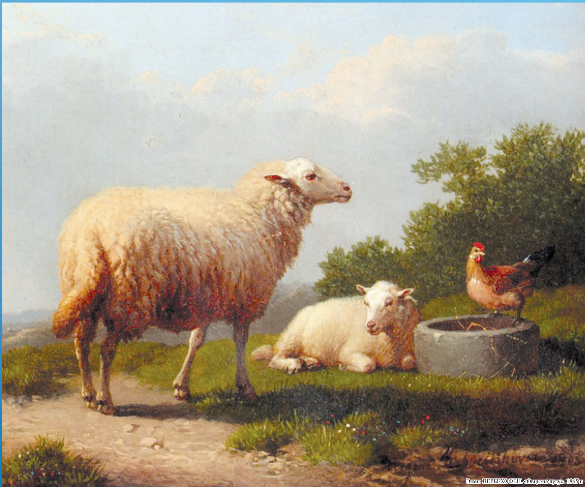
Эжен ВЕРБЕХОФЕН, «Овцы на дугу», 1865 г.