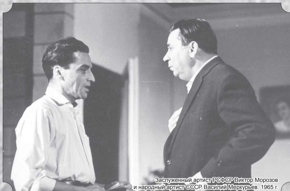
Заслуженный артист РСФСР Виктор Морозов и народный артист СССР Василий Меркурьев. 1965 г.